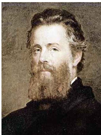
Herman Melville um 1870, gemalt von Joseph Eaton.

Eingebettet in das Aussendrama Ahab/Moby Dick ist die Binnen-Tragödie zwischen dem Kapitän und seinem Ersten Steuermann. Starbuck, Mann des vernünftigen Masses, hält Ahab entgegen: «Rache an einem stummen Tier, das einfach dich aus blindem Trieb getroffen, Wahnsinn!» Doch Ahab's Wahnsinn schlägt Starbuck's Sinn. Einmal steht Starbuck mit